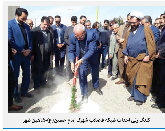
کلتک زنی احداث شبکه فاضلاب شهرک امام حسین (ع) - شاهین‌شهر