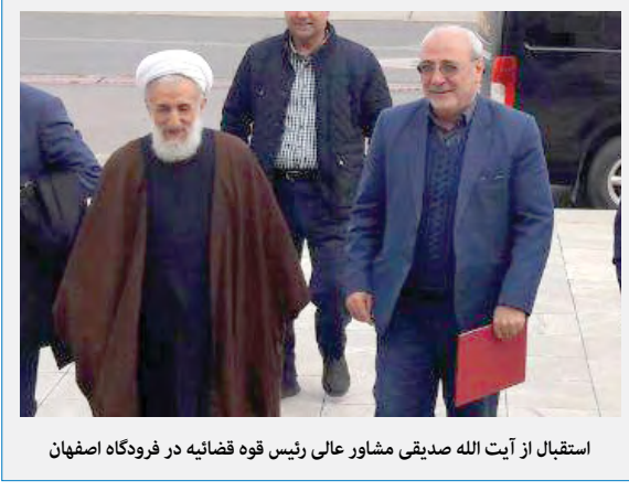
استقبال از آیت الله صدیقی مشاور عالی رئیس قوه قضائیه در فرودگاه اصفهان