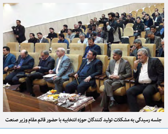
جلسه رسیدگی به مشکلات تولیدکنندگان حوزه انتخابیه با حضور قائم مقام وزیر صنعت