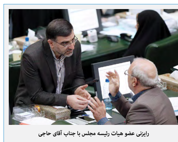
رایزنی عضو هیات رئیسه مجلس با جناب آقای حاجی