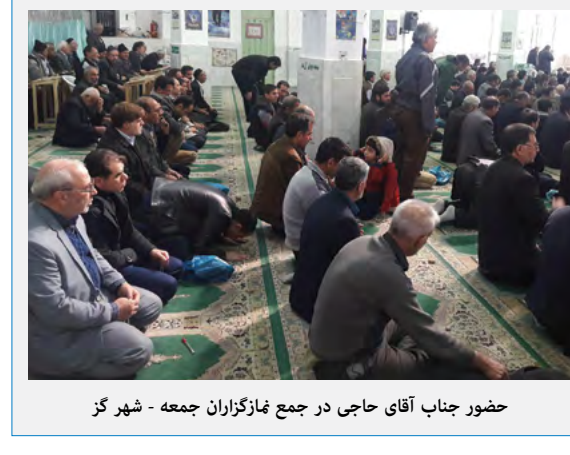
حضور جناب آقای حاجی در جمع نمازگزاران جمعه - شهر گز