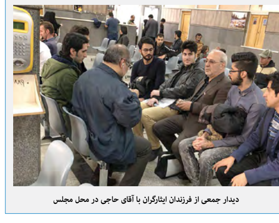
دیدار جمعی از فرزندان ایشانگران با آقای حاجی در محل مجلس