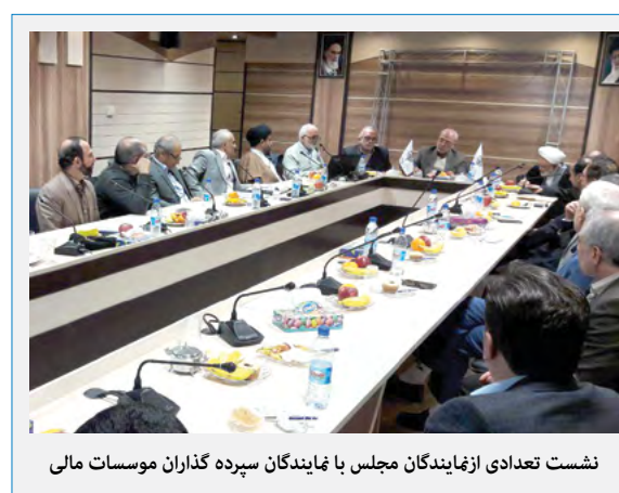
نشست تعدادی از نمایندگان مجلس با نمایندگان سپرده‌گذاران موسسات مالی