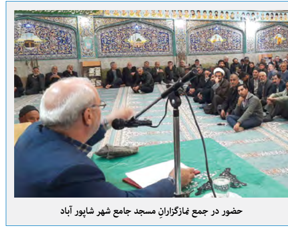
حضور در جمع نمازگزاران مسجد جامع شهر شاپور آباد