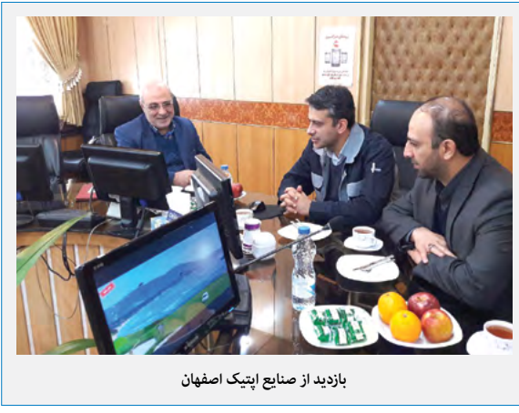
بازدید از صنایع اپتیک اصفهان