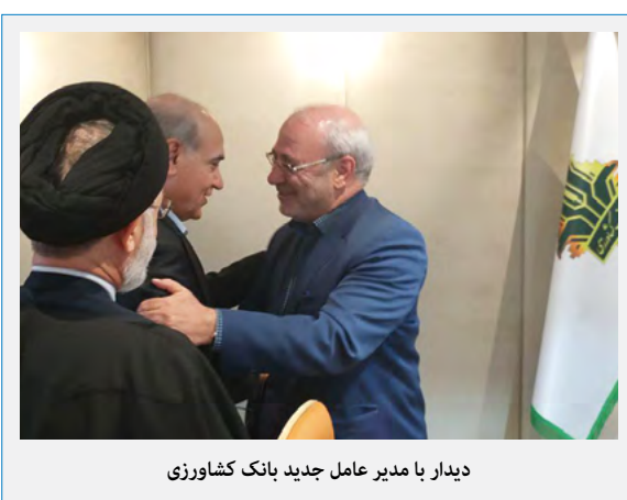
دیدار با مدیر عامل جدید بانک کشاورزی