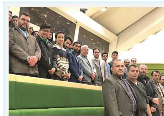
حضور نخبگان استان اصفهان (سفیران اعتلای اندیشه استان) در صحن مجلس