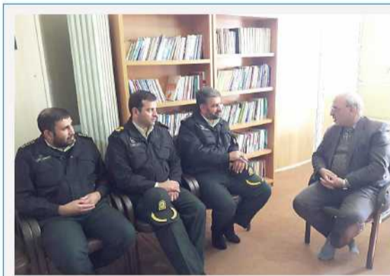
دیدار فرمانده جدید نیروی انتظامی شهرستان برخوار