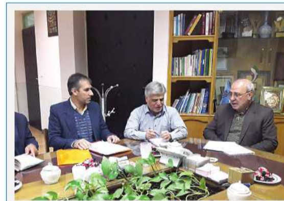
دیدار و گفت و گو با مدیر کل تجهیز و نوسازی مدارس استان اصفهان