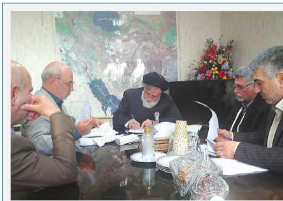
رسیدگی به مشکل جمعی از بانزاشتگان بنیاد شهید در جلسه با حجت الاسلام شهیدی