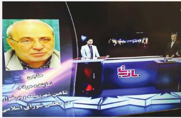
حاجی در دومین جشنواره زعفران روستای ازان:

آقای حاجی در پایان خاطر نشان ساخت: مهم ترین مطالبه بنده و دیگر نمایندگان استان در تمام جلسات مهم و ملی، موضوع تأمین آب شرب و کشاورزی استان اصفهان است و تا حصول نتیجه، این خواسته را پیگیری خواهیم کرد.