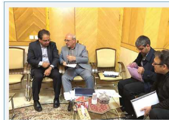
دیدار با معاون شهرسازی و معماری وزیر راه و شهرسازی