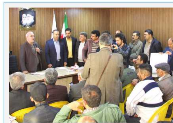
اجتماع جایزه داران و رانندگان نانکرهای حمل سوخت جهت قدردانی از آقای حاجی