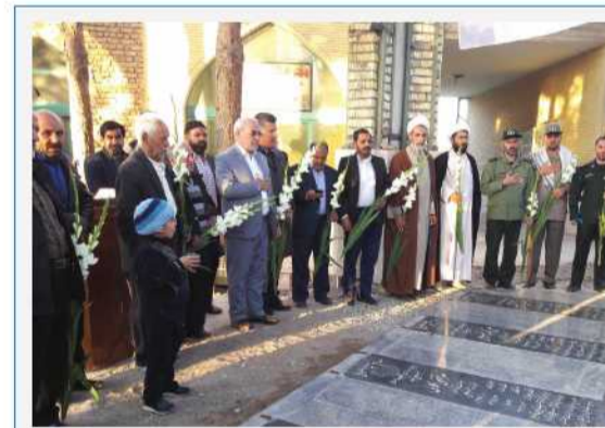
ادای احترام و غبار رویی از قبور مطهر شهدای شهر دولت آباد