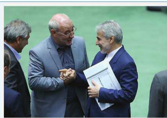
دیدار و گفت و گو با دکتر نوبخت در صحن مجلس

کوشه ای از فعالیت های آقای حاجی در آبان ماه