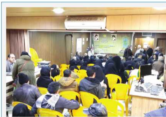
ملاقات مردمی در شاهین شهر