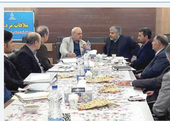
دیدار و گفت و گو با مدیر کل ثبت اسناد و املاک استان اصفهان