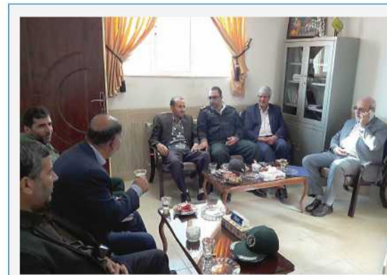
حضور و سخنرانی مناسبت هفته بسیج در حوزه مقاومت شهر چادگان