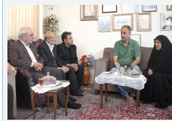
دیدار با مادر شهیدان سرلشکر علیرضا و رضا یاسینی