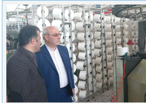
بازدید از کارخانه نخ و الیاف