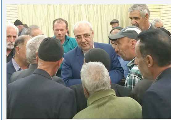
حضور در مسجد جامع کز برخوار