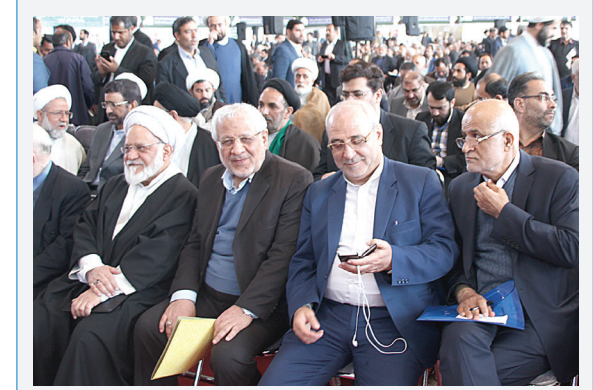
دومین مجمع ملی جبهه مردمی نیروهای انقلاب اسلامی