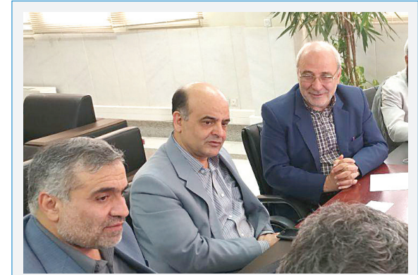
حضور عظیمیان معاون وزیر راه و شهر سازی و رئیس سازمان زمین و مسکن