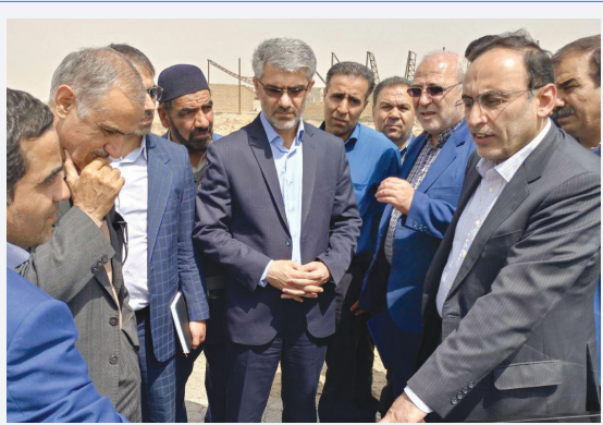
حضور طرفه معاون عمرانی استاندار در منطقه

گوشه ای از فعالیت های آقای حاجی در فروردین ماه