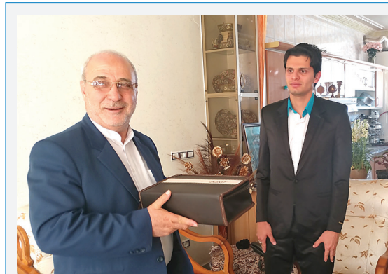
دیدار و تقدیر از ورزشکار دو و میدانی جهانی، بهمن علی نجیمی