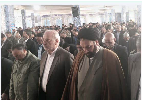
شرکت در نماز جمعه دولت آباد