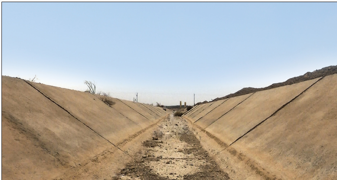
آقای حاجی در تذکر شفاهی خطاب به وزیر نیرو مطرح کرد: