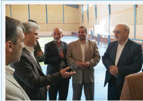
بازدید از سالن ورزشی محسن آباد