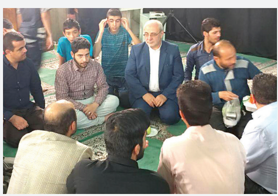
حضور در جمع معتقدین مسجد الرسول ص دانشگاه مالک اشتر شاهین شهر