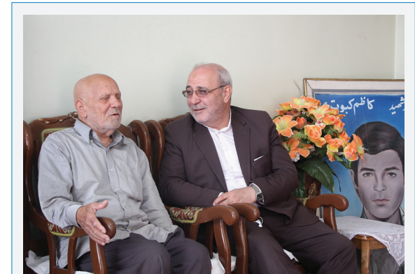
دیدار با خانواده شهید کیوتری