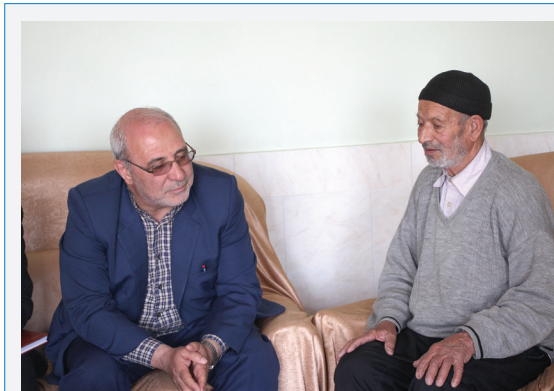
دیدار با خانواده شهید حق شناس