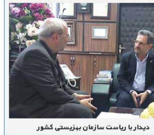
دیدار با ریاست سازمان بهزیستی کشور