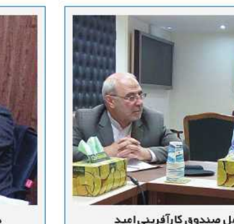
دیدار با مدیر عامل صندوق کارآفرینی امید