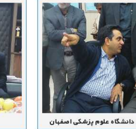
جلسه با معاون درمان دانشگاه علوم پزشکی اصفهان