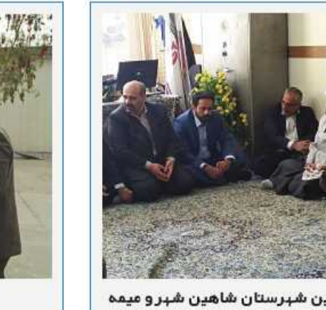
دیدار نوروزی با مسئولین شهرستان شاهین شهر و میمه