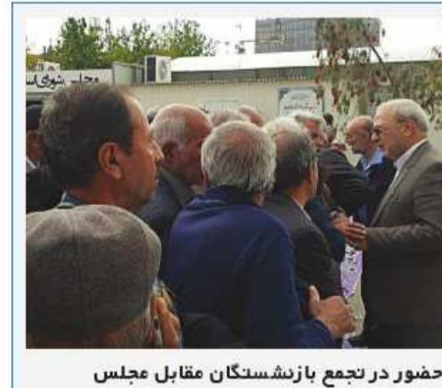
حضور در تجمع بازداشتگان مقابل مجلس