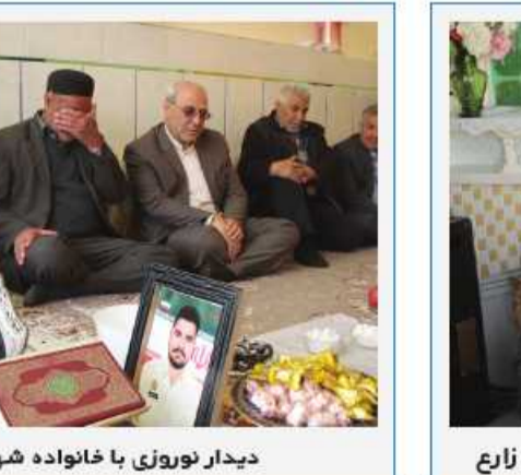
دیدار نوروزی با خانواده شهید مدافع حرم، شهید زارع