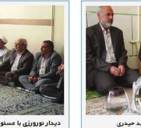
دیدار نوروزی با خانواده شهید حیدری